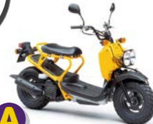
A Honda Zoomer 50 18 4s 5.2