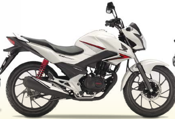
E Honda CB 125F 23 4s 10.6