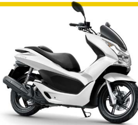
C Honda PCX 125 18 4s 11.7