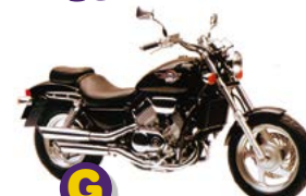
G Honda VF-750 23 4s 43