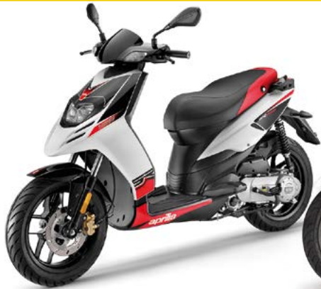
A Aprilia SR Motard 50 18 2s 5.4