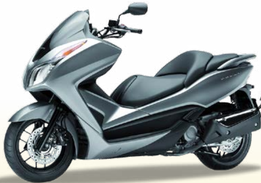
E Honda Forza NS 300 20 4s 19.2