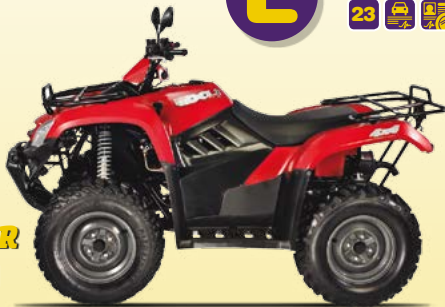
18 4s 8.5