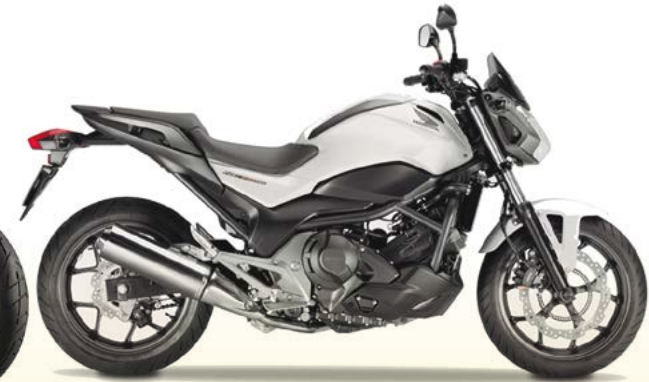
G Honda NC 750X 23 4s 55