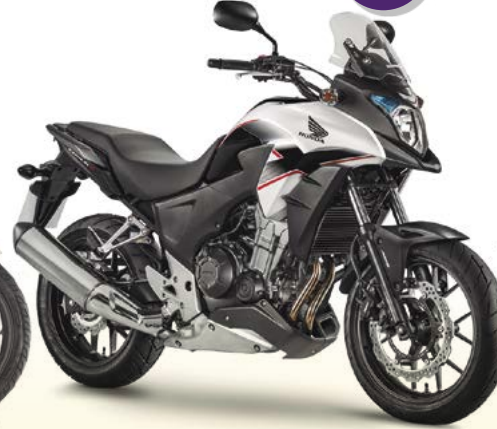
F Honda CB 500X 23 4s 47