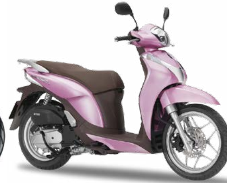
C Honda Mode 125 18 4s 11.7