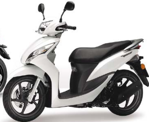
B Honda Vision 110 18 4s 8.9