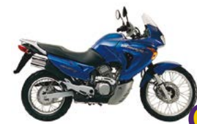
G Honda Transalp XL 650V 23 4s 52