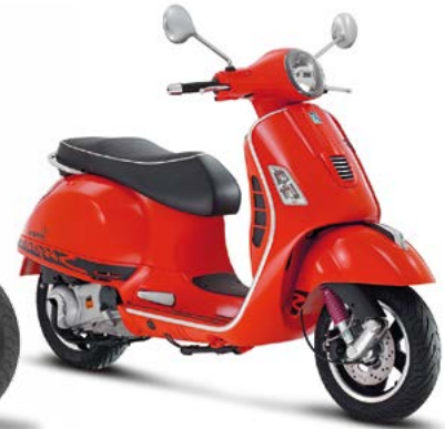
D Vespa LX 125 20 4s 9.5